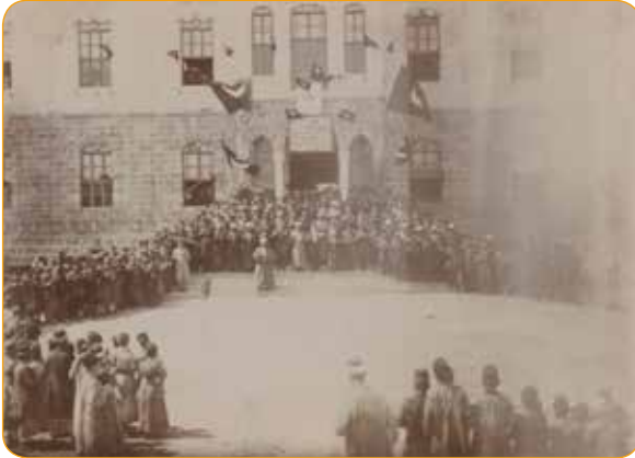
Resim 2: Niğde Eski Hükümet Konağı 2

Resim 1: Niğde Hükümet Konağı'nın 1898 senesinde açılış Töreni 1