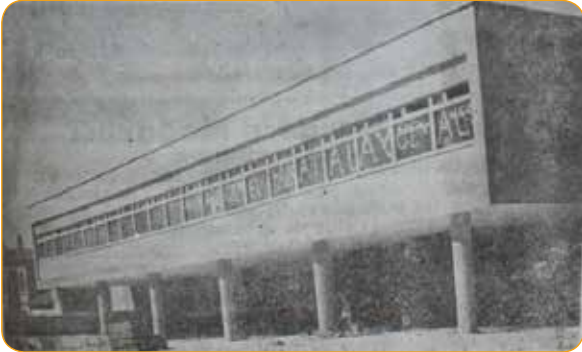
Resim 6: Yeni Hükümet Konağı İnşaat (1965) 7

1965 senesinde hazırlanan 42. Yılında Niğde İli isimli eserde de hükümet konağı inşaatının verilen keşif ile 20 Aralık 1965 tarihinde bitirilmesinin planlandığı belirtilmektedir.