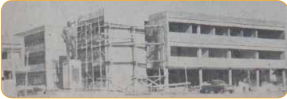
Resim 5: Yeni Hükümet Konağı İnşaatı (1964) 6

1964 senesinde hazırlanan Cumhuriyetin 41. Yılında Niğde isimli eserde, 20 Aralık 1965'de bitirmek üzere, 7 Temmuz 1964 tarihinde ihaleye verildiği belirtilmektedir. Adı geçen eserde hükümet konağı inşa halindedir.