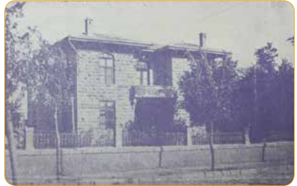
Resim 7: Niğde Vali Konağı (1929) 10

Yeni Vali Konağı ise Kayabaşı mahallesinde Askeri kışlalar mevkiinde 5080 m 2 lik bir saha üzerinde yapılmaya başlanmış ve Cumhuriyetin 50. Yıl kutlamaları haftasında bitirilmesi tasarlanmıştır. Bu konak bugün mevcut olan Niğde Vali Konağıdır 9 .