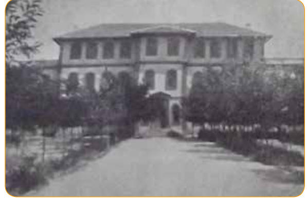
Fotoğraf 6. Niğde Orta Okulu (Günümüzde Niğde Anadolu Lisesi) (1938) 12

Şimdi (1937) yarısı Milli Kütüphaneye, yarısı Halkevine ayrılan yapıda o vakit matbaa duruyordu. Tabii, takımları hem az, hem de pek iptidai (ilkel) idi. (Bugün (1937) matbaanın ayrı binası vardır ve bütün levazımı (araç gereçleri) tamdır: Motorlu makinesine dek...)