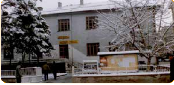
Resim 4: Sungurbey İl Halk Kütüphanesi (mevcut değil)

geçici hükümet konağı olarak kullanıldığı dile getirilmiştir 5 .