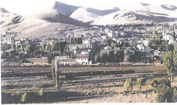
TREN ULUKIŞLASI – YAYLAKENT

Niğdemizin beş ilçesinden biri olan Ulukışla, coğrafi konumu ve stratejik önemi nedeniyle hemen her dönemde önemli bir yerleşim merkezi olmuştur. İlk söylenişi Ulukışlak olan ilçemiz, tarih boyunca İpekyolu güzergahında kervanların sık sık konakladığı, canlı ve hareketli bir yerleşim yeri olmuştur.